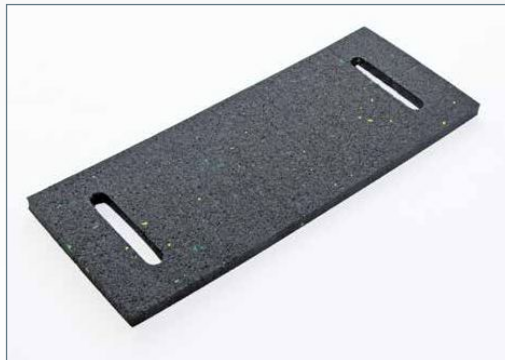
Die Unterseite der Regupol® Gurtbandschoner besteht aus dem Material der bewährten Regupol® Antirutschmatten