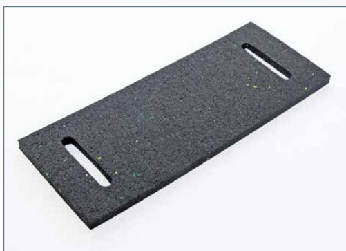
Die Unterseite der Regupol® Gurtbandschoner besteht aus dem Material der bewährten Regupol® Antirutschmatten